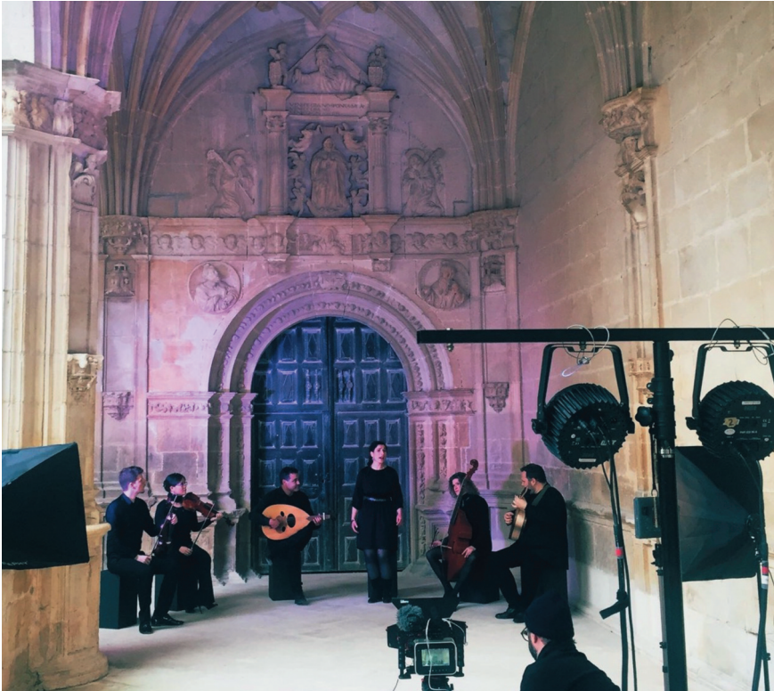
Rodaje del vídeo de Amendux en el monasterio de Irache.

Por otro lado, en lo que atañe al contexto sociohistórico, musical y estético de la obra, hubo también propuestas novedosas. A nuestro juicio, la obra de Amendux tiene mucho de literario; no ha de responder necesariamente a hechos puramente autobiográficos. Es una elegía, un epitafio muy de moda en la época renacentista que vivió Amendux; un Amendux con recursos que le permitieron incluso a viajar a Flandes. Por eso mismo, quisimos alejar la composición de la estética tradicional vasca, o de las composiciones populares como los versos, y vincularla con un género culto de moda en Europa en aquella época. No tratándose, por tanto, de versificación popular, el poema de Amendux cobra relevancia, pues se trataría de una de las pocas muestras de poesía culta de la Europa del Renacimiento escrita en lengua vasca 5 .