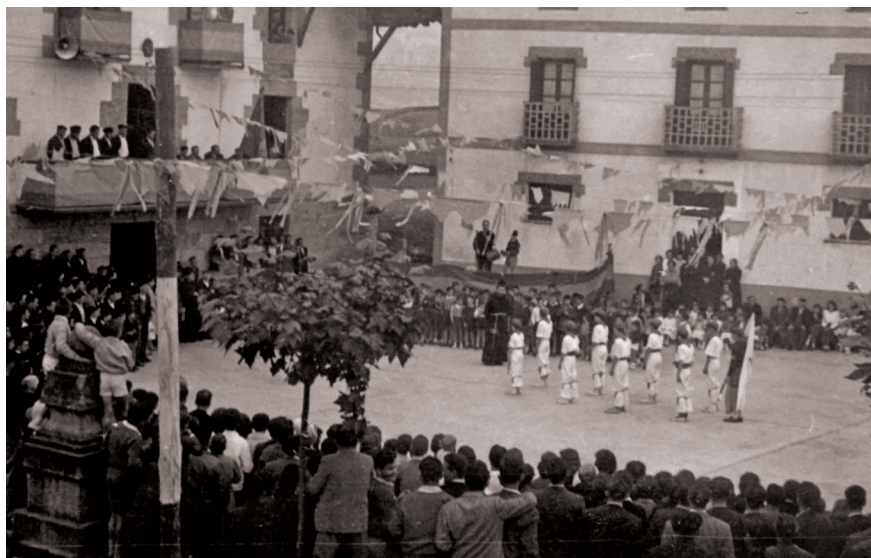
Arbizu, 22 de junio de 1958. Ceremonia de entrega de diplomas y cartillas a los niños por hablar vascuence. Danzas de la juventud de San Antonio de Pamplona.