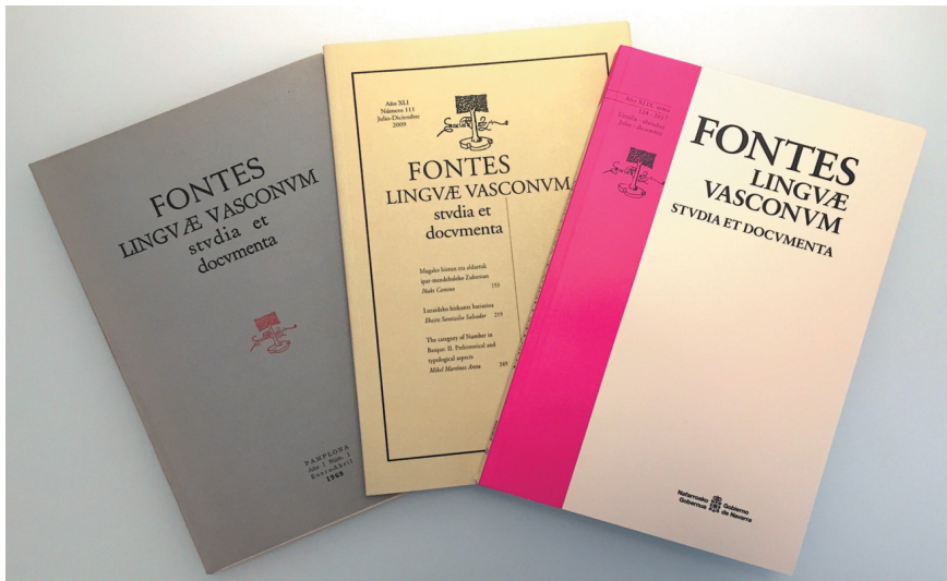
Ejemplares de Fontes Linguae Vasconum en diferentes épocas.

El futuro próximo parece halagüeño para FLV. Por un lado, la cantera de investigadores, de los que se nutre la revista, parece estar asegurada y, por otro, la revista puede satisfacer por el momento los requerimientos y estándares –cada vez más estrictos– de las publicaciones científicas a nivel internacional. Sin embargo, no se debe ocultar que dichas exigencias requieren de una inversión cada vez mayor de tiempo, dinero y capital humano: que la lingüística vasca tenga su parcela propia en el ámbito de la lingüística general es y será en el futuro un objetivo más caro. El devenir de FLV, como el de otras publicaciones, dependerá de la capacidad de resistencia y adaptación al medio, y del apoyo institucional.