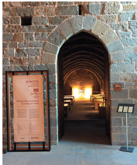
Entrada a la exposición en la sala Sancho el Sabio del Archivo Real y General de Navarra.

Entre el 15 de febrero y el 31 de marzo de 2019 el Archivo Real y General de Navarra acogió en su sala protogótica la exposición Fontes Linguae Vasconum: Tesoros de papel . En esta exposición, además de la historia la propia revista, el visitante pudo contemplar una selección de los documentos antiguos originales más importantes conservados mayoritariamente en Navarra, y entender