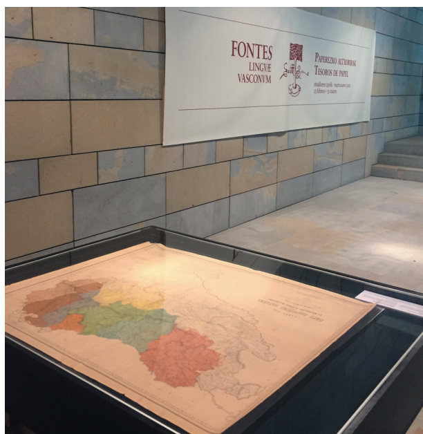
Original del mapa de los dialectos de L. L. Bonaparte (1863), a la entrada de la exposición.