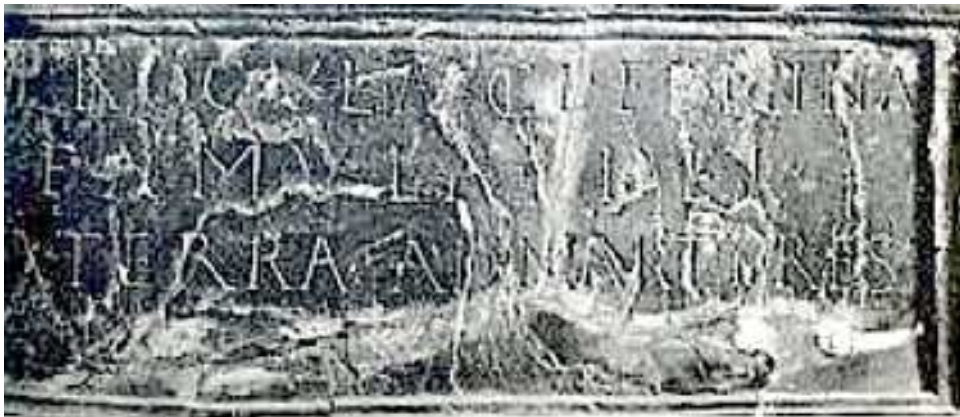
Procla cl[arissima] femina « Procla noble dame » Famula dei « Servante de Dieu » A terra ad martyres « [Va] de la terre auprès des martyres » 547

Voici l'inscription et la photographie de celle-ci :