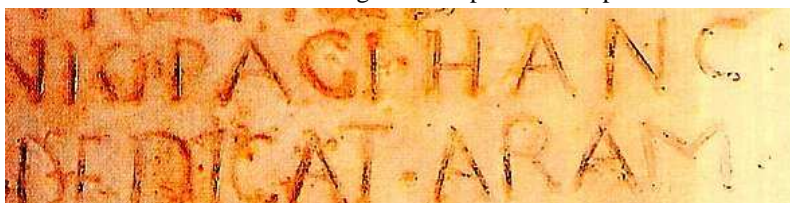
Les deux dernières lignes de la pierre d'Hasparren

Gorrochategui prétendrait-il également que la pierre d'Hasparren est un faux ? 556