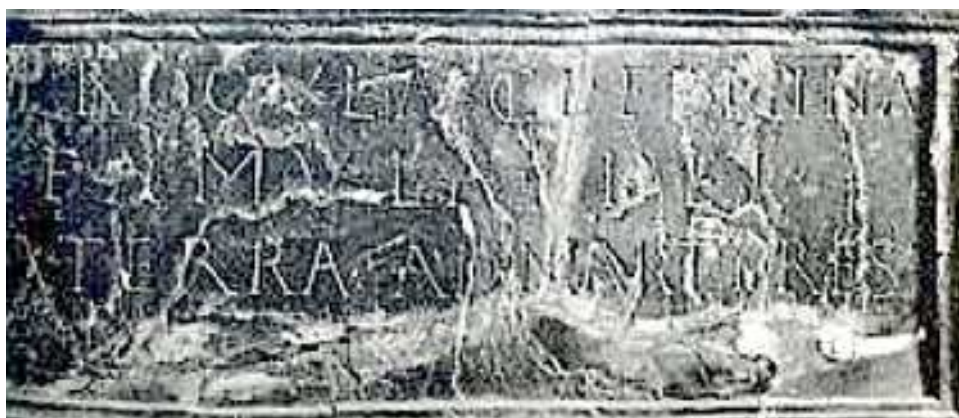
Procla cl[arissima] femina « Procla noble dame » Famula dei « Servante de Dieu » A terra ad martyres « [Va] de la terre auprès des martyres » 545

Voici l'inscription et la photographie de celle-ci :