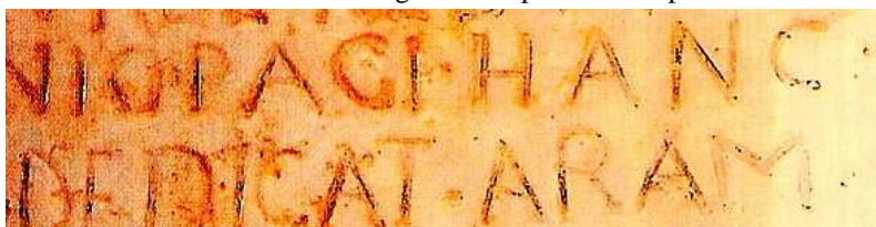
Les deux dernières lignes de la pierre d'Hasparren

Gorrochategui prétendrait-il également que la pierre d'Hasparren est un faux ? 554 La question, dans toute sa simplicité, est posée 555 .