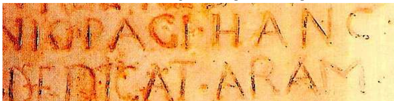
Les deux dernières lignes de la pierre d'Hasparren

Gorrochategui prétendrait-il également que la pierre d'Hasparren est un faux ? 552 La question, dans toute sa simplicité, est posée 553 .