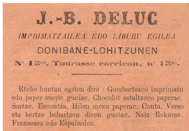
Deluc 1885: Almanaka Berria