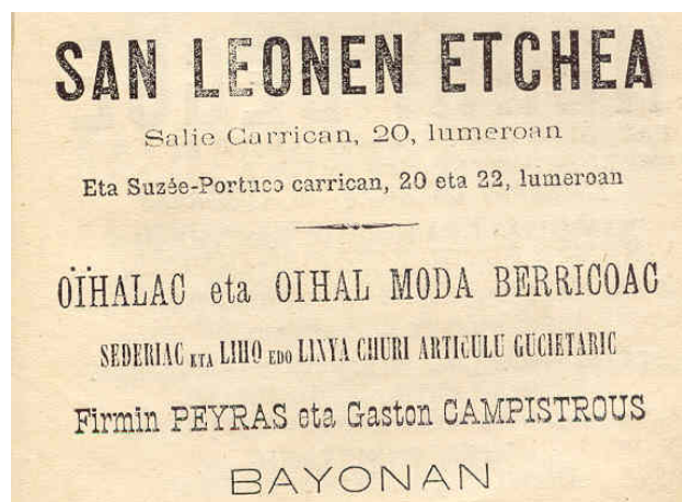
Saint Léon 1884: Escualdun Almanac edo egunari berria