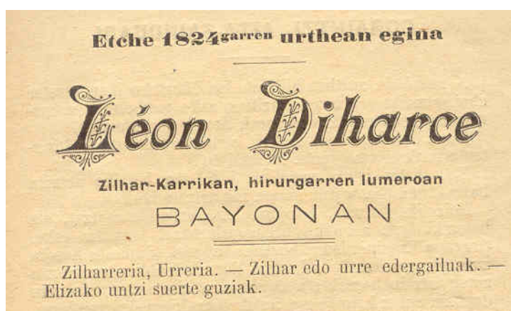
Diharce 1896: Eskualdun Gazetaren Almanaka