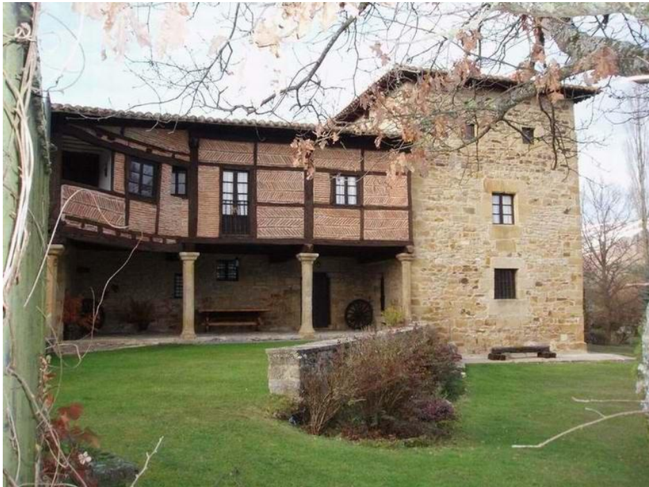
Juan Perez de Lazarragaren dorretxea Larrean.